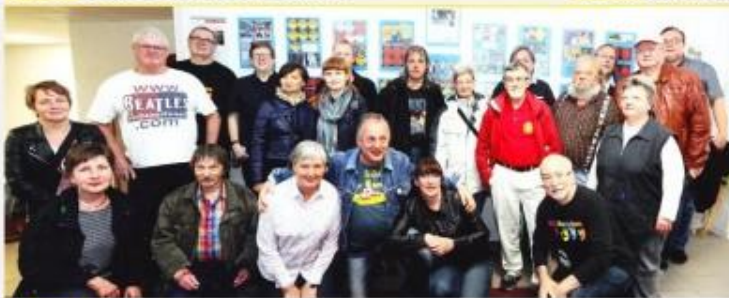
2. Teil: Sonderausstellungsbesuch zum 80. Geburtstag von Jimmy Nicol