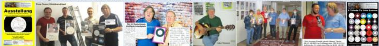
BEAT ARCHIV (02.10.2020) & Ausstellungsbesuch & Soundcheck (03.10.2020)